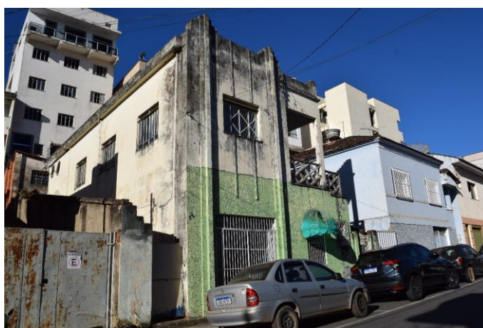
Imagem 02: Imóvel localizado à rua Joaquim Teófilo, nº 55. Fotografia de Jaíne Diniz Corrêa, mai/2023.