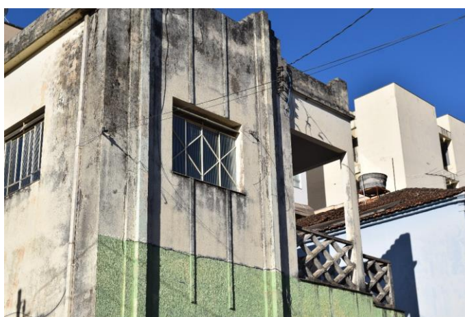
Imagem 04: Detalhes do imóvel. Fotografia de Jaíne Diniz Corrêa, mai/2023.