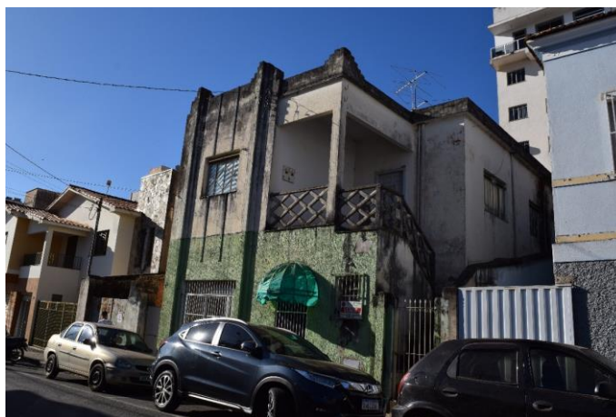
Imagem 01: Imóvel localizado à rua Joaquim Teófilo, nº 55. Fotografia de Jaíne Diniz Corrêa, mai/2023.