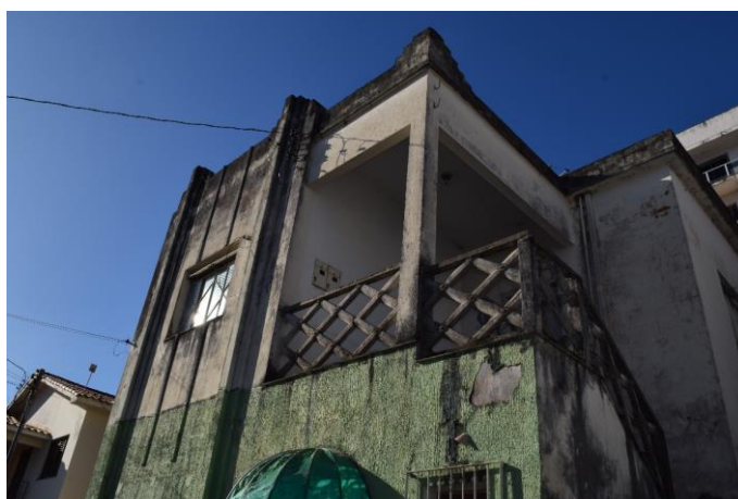
Imagem 05: Detalhes do imóvel. Fotografia de Jaíne Diniz Corrêa, mai/2023.