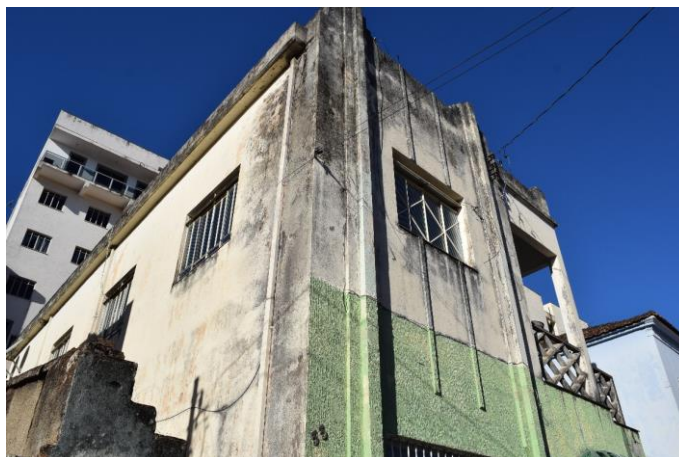
Imagem 03: Detalhes do imóvel. Fotografia de Jaíne Diniz Corrêa, mai/2023.