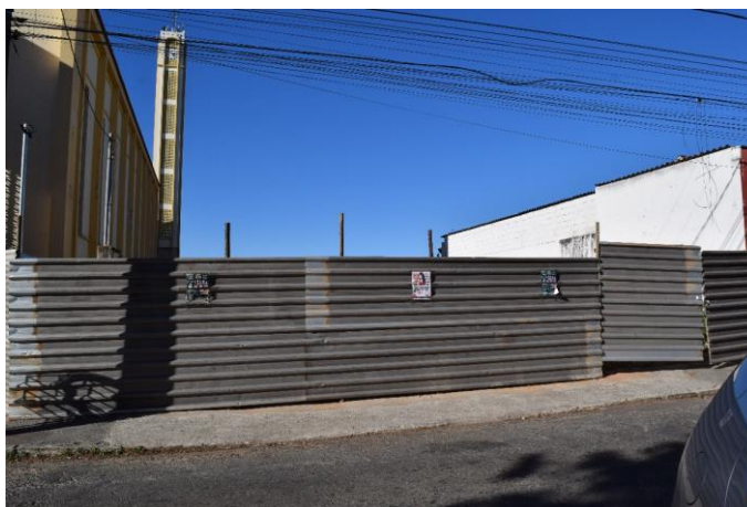
Imagem 01: Local onde antes estava edificado o imóvel. Fotografia de Jaíne Diniz Corrêa, mai/2023.