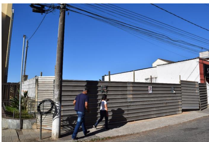
Imagem 02: Local onde antes estava edificado o imóvel. Fotografia de Jaíne Diniz Corrêa, mai/2023.