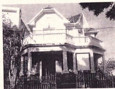
Figura 01 - Vista da fachada frontal. Autoria: Anderson Silva Data: janeiro de 2008 Acervo: Prefeitura Municipal