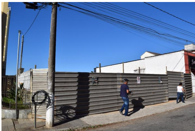
Imagem 03: Local onde antes estava edificado o imóvel. Fotografia de Jaíne Diniz Corrêa, mai/2023.