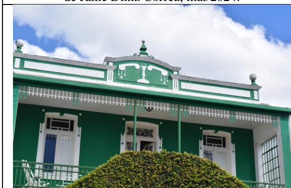
Imagem 03: Detalhes do imóvel. Fotografia de Jaíne Diniz Corrêa, mai/2024.