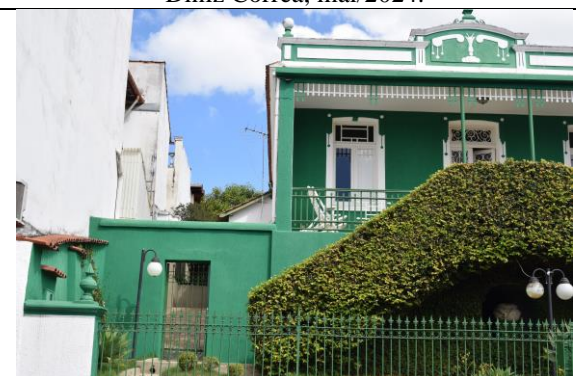
Imagem 04: Detalhes do imóvel. mai/2024.