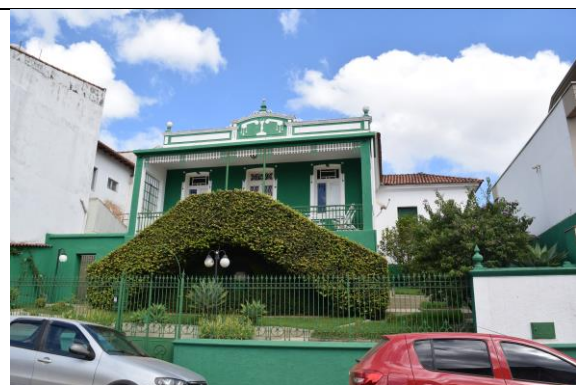
Imagem 02: Fachada principal. Fotografia de Jaíne Diniz Corrêa, mai/2024.