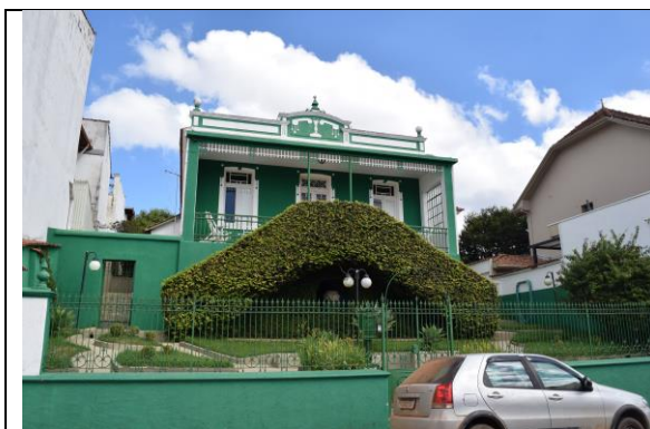
Imagem 01: Fachada principal do imóvel. Fotografia de Jaíne Diniz Corrêa, mai/2024.