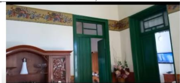
Imagem 05: Pinturas parietais no interior da edificação. Imagem retirada do vídeo “A Casa Verde da Família Westin, jun/2022.