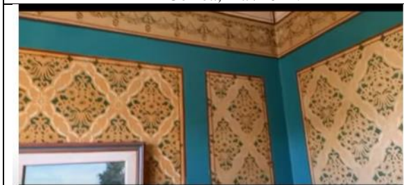
Imagem 04: Pinturas parietais no interior da edificação. Imagem retirada do vídeo “A Casa Verde da Família Westin, jun/2022.