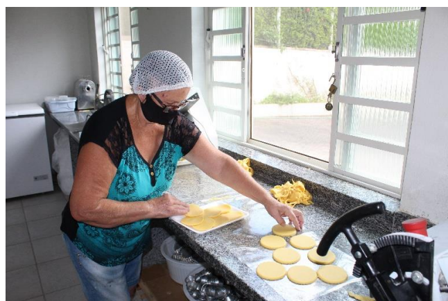
Imagem 02: Durante o preparo do pastel. dez. 2021.