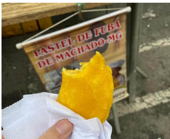
Imagem 04: Participação do Pastel de Fubá de Machado no Encontro de Turismo Rural realizado em Poços de Caldas. Fotografia da Prefeitura de Poços de Caldas. Acervo da Prefeitura Municipal de Machado, jun/2022.