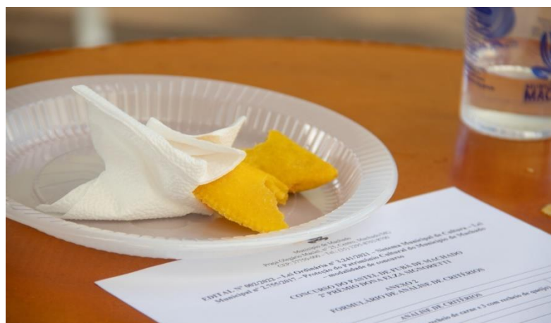
Imagem 05: Concurso do Pastel de Fubá de Machado. Fotografia do acervo da Prefeitura Municipal de Machado, nov/2022.