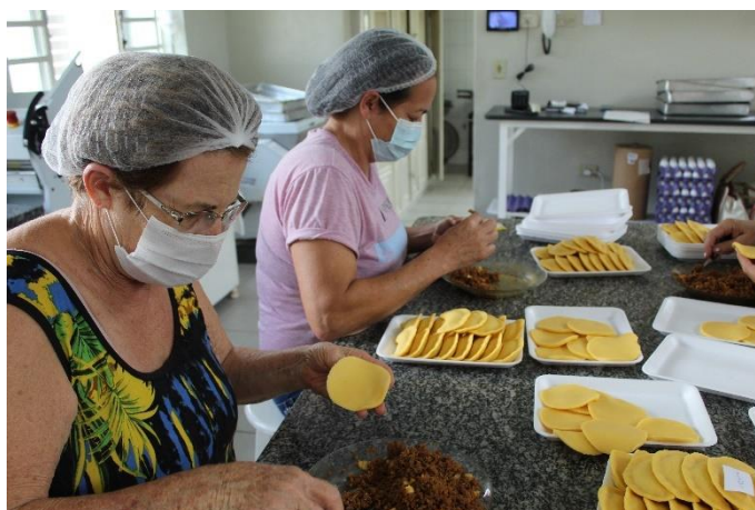
Imagem 03: Durante o preparo do pastel. Fotografia de Cristiane Magalhães, dez. 2021.