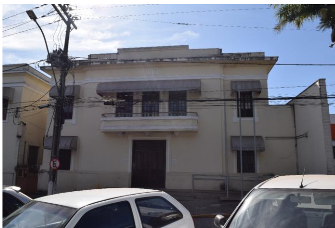
Imagem 01: Prédio do antigo Fórum de Machado.