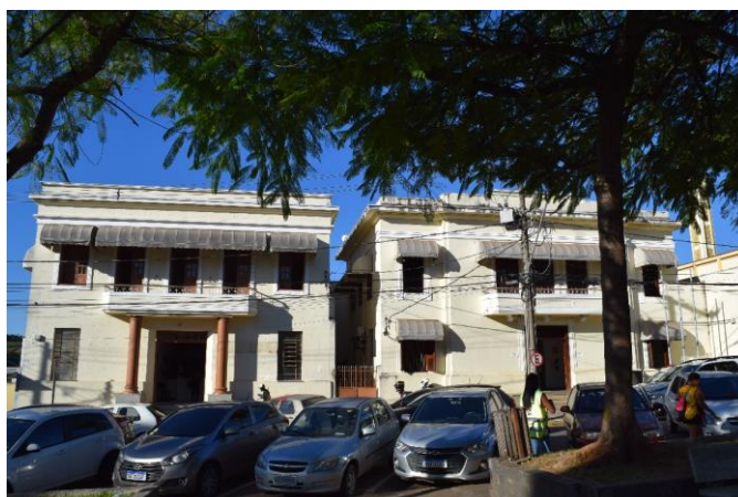
Imagem 03: À direita prédio do Fórum e a esquerda antiga Prefeitura. mai/2023.