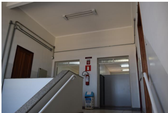
Imagem 06: Interior do prédio do antigo Fórum. Fotografia de Jaíne Diniz Corrêa, mai/2023.