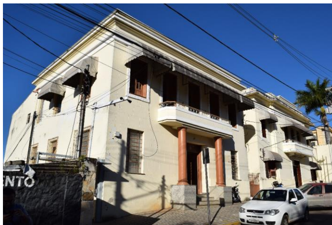
Imagem 04: Prédio da antiga prefeitura em primeiro plano e Fórum à direita. Fotografia de Jaíne Diniz Corrêa, mai/2023.