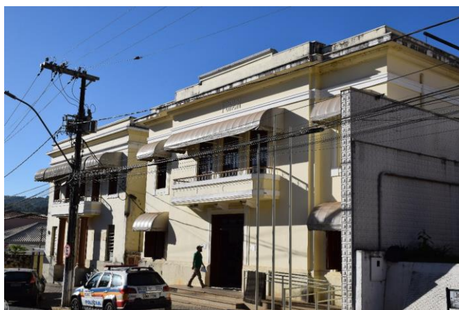
Imagem 02: Prédio do antigo Fórum de Machado. Fotografia de Jaíne Diniz Corrêa, mai/2023.