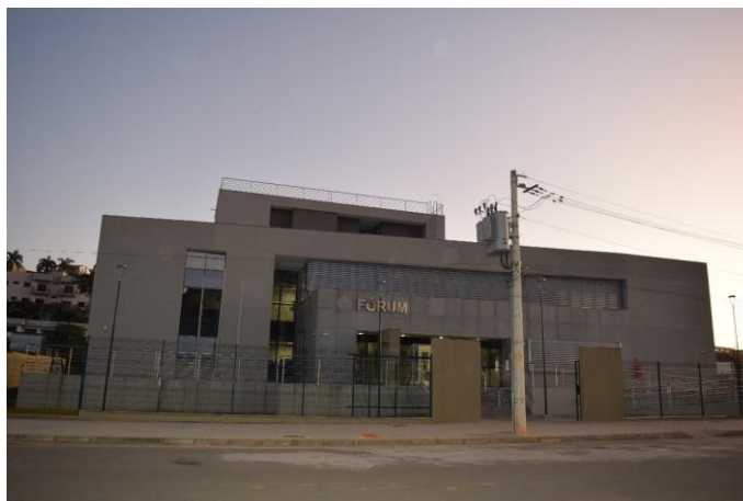
Imagem 09: Novo Fórum de Machado. Fotografia de Jaíne Diniz Corrêa, mai/2023.