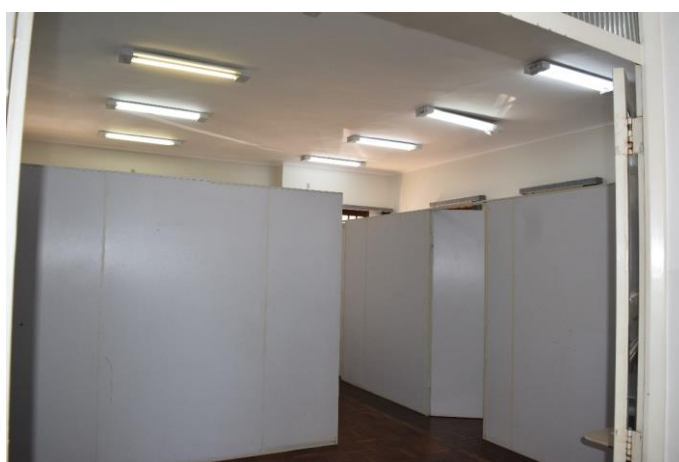
Imagem 07: Interior do prédio do antigo Fórum. Fotografia de Jaíne Diniz Corrêa, mai/2023.