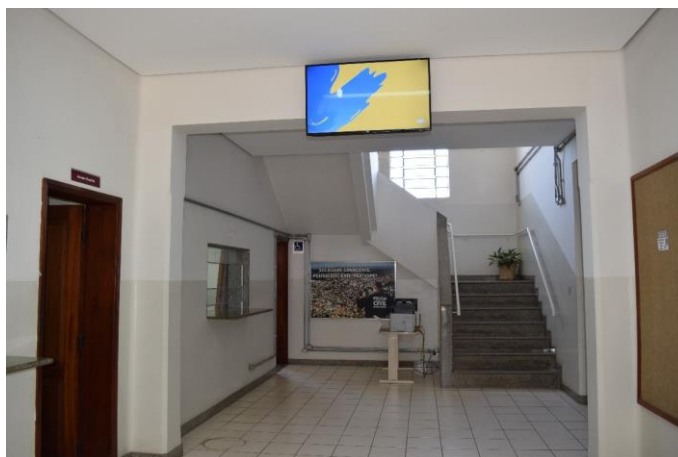
Imagem 05: Interior do prédio do antigo Fórum. Fotografia de Jaíne Diniz Corrêa, mai/2023.