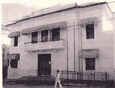
Figura 01 - Vista da fachada frontal. Autoria: Anderson Silva Data: janeiro de 2008 Acervo: Prefeitura Municipal