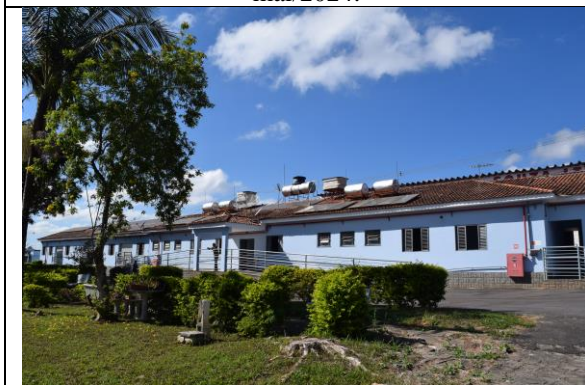
Imagem 03: Interior do Lar São Vicente de Paulo.