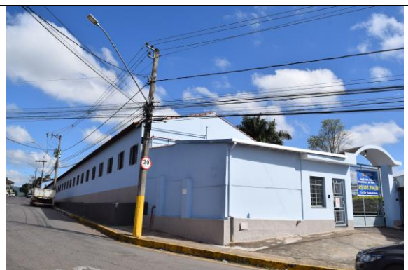
Imagem 02: Fachada para a Av. Dr. Athayde. Fotografia de Jaíne Diniz Corrêa, mai/2024.