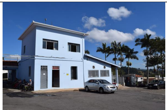
Imagem 04: Parte do prédio que constitui o antigo dispensário. Fotografia de Jaíne Diniz Corrêa, mai/2024.