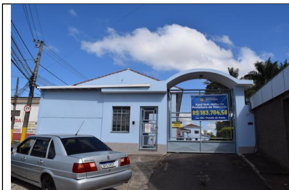
Imagem 01: Acesso ao Lar São Vicente de Paulo de Machado. Fotografia de Jaíne Diniz Corrêa, mai/2024.