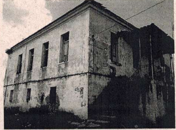
Vista do Acesso Principal