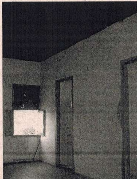
Detalhe do Interior da Sala Principal