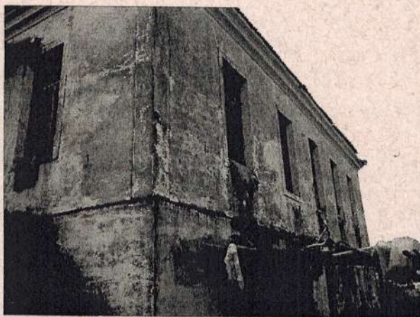
Vista Geral da Lateral Direita