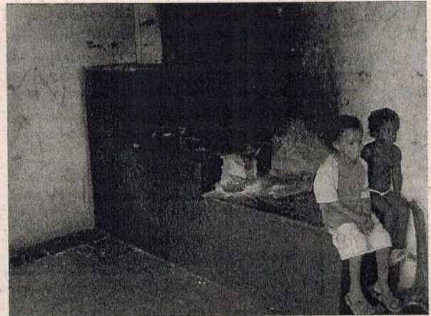
Detalhe do Fogão a Lenha