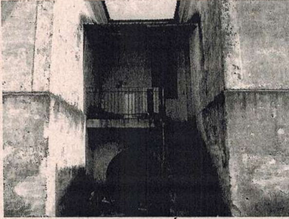
Detalhe do Acesso da Área de Serviço