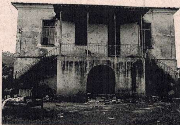
Vista Geral da Fachada Principal