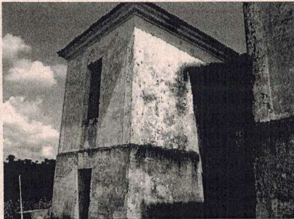
Detalhe da Fachada dos Fundos